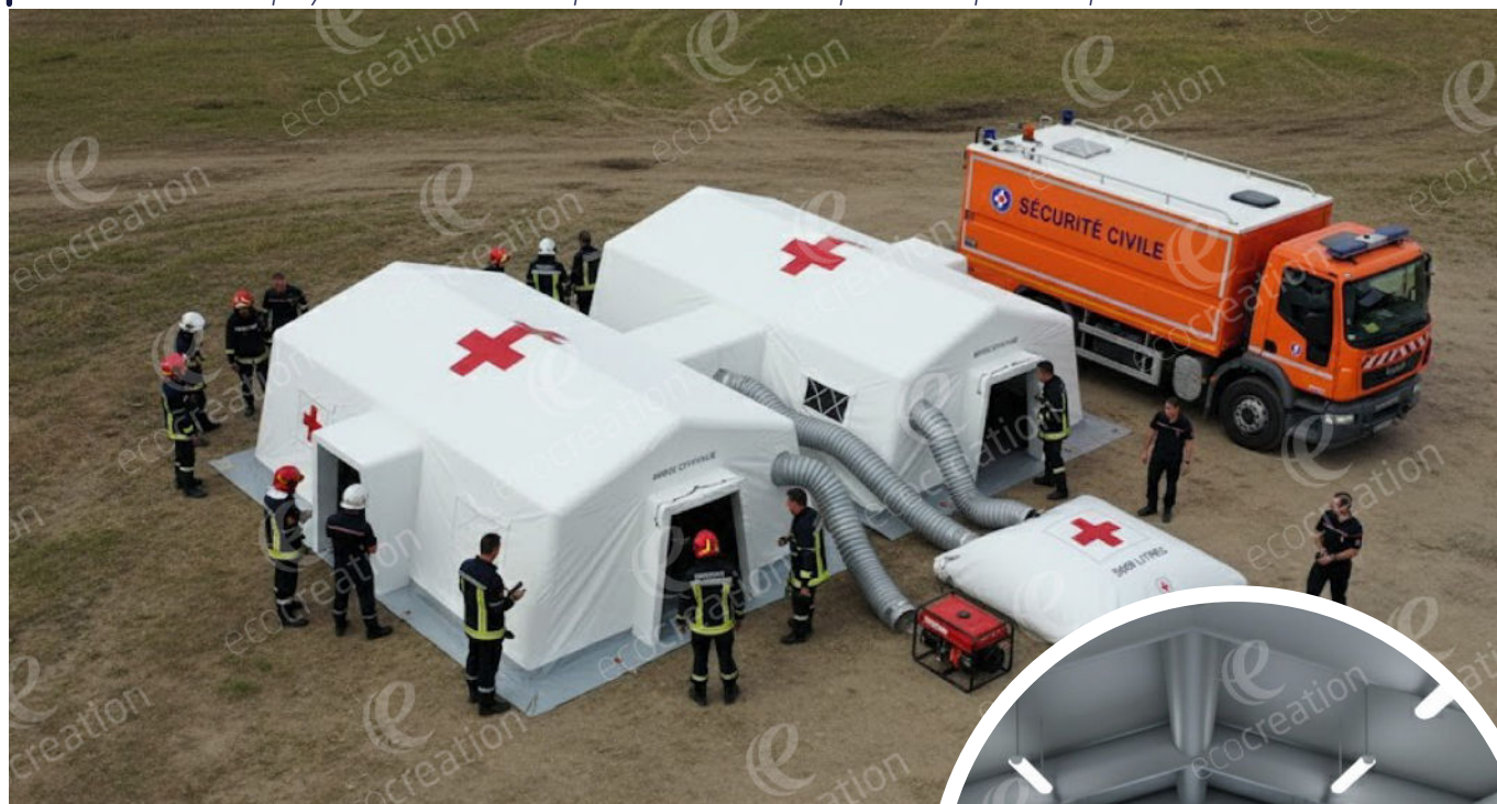
Tentes de secours VT2

Tente de secours polyvalente & modulaire permettant la mise en place d'un poste de premiers secours