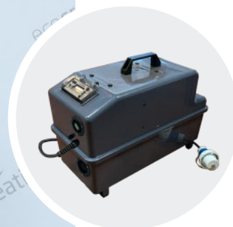
Tentes de secours VT2